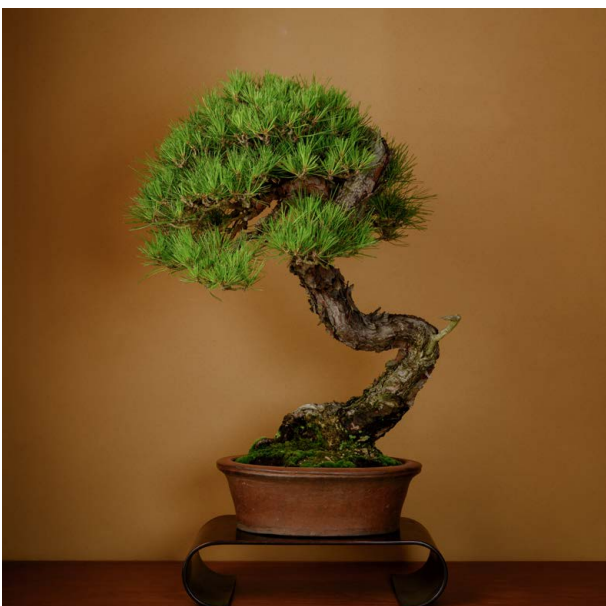
「赤松」樹齢約100年、樹高 70cm