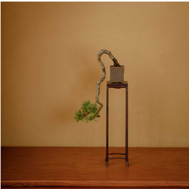
「黒松 懸崖」樹齢約50年、樹高31cm