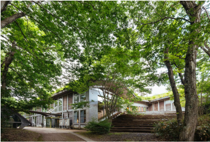
御所野縄文博物館

縄文時代中期後半（5,000～4,200年前）の大規模なムラの跡で、東西に細長い約77,000m 2 の台地のほぼ全面に竪穴住居跡が800棟以上見つかっています。竪穴住居跡や盛土遺構、配石遺構などが分布しており、800年間という長期にわたって人々が定住した集落跡です。1993年、縄文時代の社会構造を知る上で貴重な遺跡として国指定史跡に指定され、2002年、遺跡を保存し御所野ムラを復元し、御所野縄文博物館を併設した「御所野縄文公園」がオープンしました。そして2021年7月27日、御所野遺跡を含む「北海道・北東北の縄文遺跡群」は、国連教育科学文化機関（ユネスコ）第44回世界遺産委員会にて、世界遺産に登録されました。