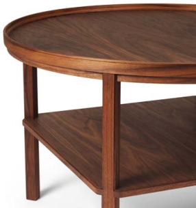
ウォールナット オイル仕上げ