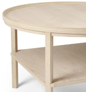
オーク ソープ仕上げ