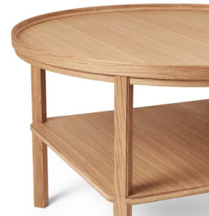
オークオイル仕上げ