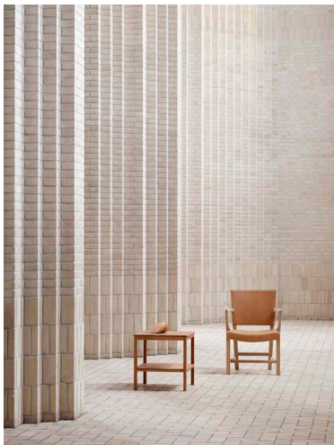
KK44860 サイドテーブル + The Red Chair