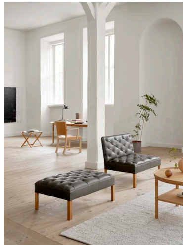
KK66870 コーヒーテーブル + Addition Sofa