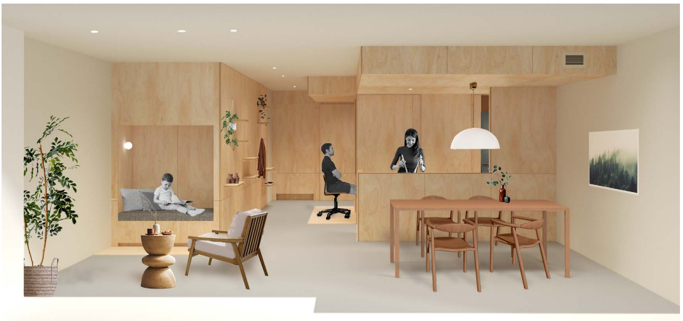
【KIGOCOCHIの商品イメージパース】

木や自然の気配を感じる「KIGOCOCHI」の仕様を実際にご覧いただけるモデルルーム 2023年10月14日（土）横浜にオープン