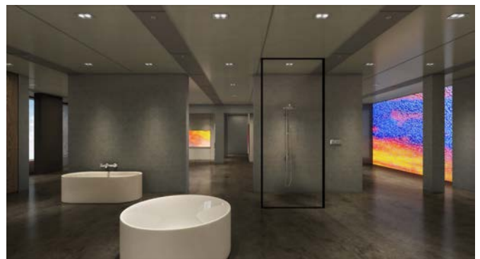
ショールーム内観（イメージ）