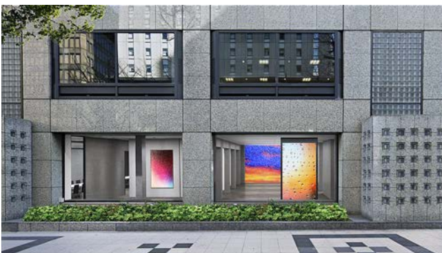
ショールーム外観（イメージ）