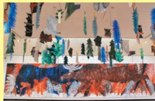
『ヘラジカの森』2014年 (2.7m×12.6m) 横須賀美術館、田川市美術館