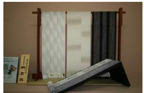
現代の明石ちぢみ

十日町市は、新潟県南部の全国屈指の豪雪地帯に位置する1500年の歴史を持つきもの産地です。全国で唯一の染めと織りの総合産地として知られていますが、十日町市のきものといった時に必ず挙げられるのが「明石ちぢみ」です。縦糸に強い撚りを加え、湯もみをして作り出す独特の「しぼ」と蝉の羽根のような薄地風の清涼感が最大の特徴です。播州明石（現在の兵庫県）に生まれ、京都西陣を経て、十日町に伝わった「明石ちぢみ」は、十日町で雪国ならではの織物に適した湿度、染色用水に利用する豊富な雪どけ水などの自然条件、さらに越後縮以来の強撚の技術と出会ったことで商品として開花し、防水加工など多くの改良が加えられ一世を風靡。その後、戦争を機に一時幻の織物となりましたが、昭和57年、国の伝統工芸品の指定を契機に再び蘇り、現在年間600点ほど生産されています。