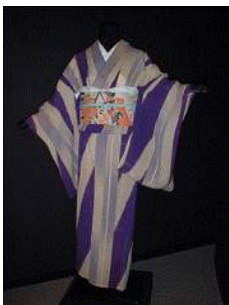
昭和初期の明石ちぢみ