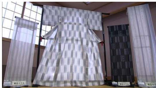
現代の明石ちぢみ