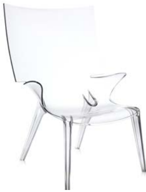
UNCLE JIM | アンクルジム