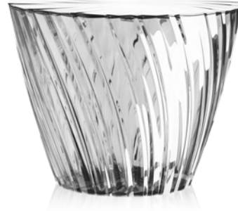
SPARKLE L TABLE | スパークル L テーブル