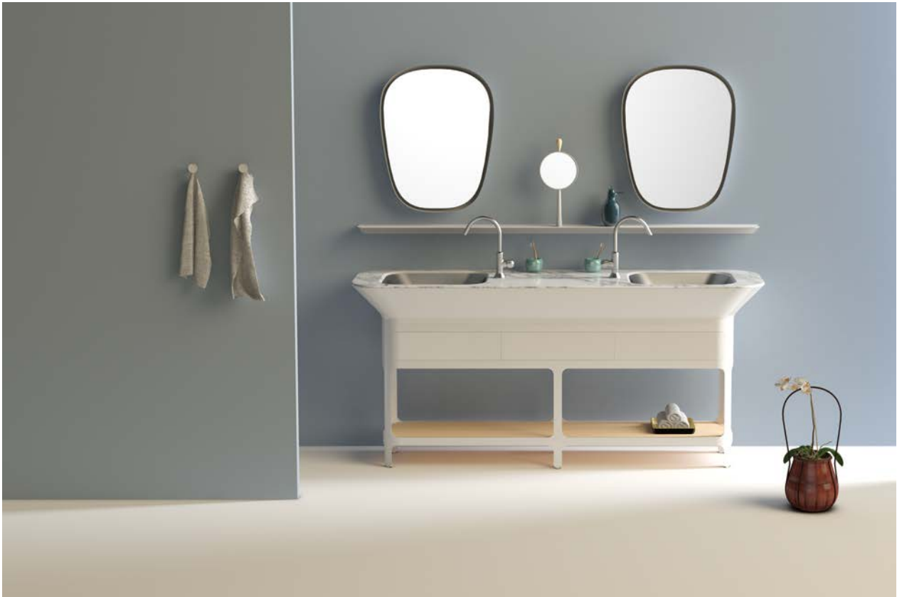
Jaime Hayon がTOYO KITCHEN SYTLEのためにデザインした新作洗面：MATERICO

GUFURUM、b.d. Barcelona Design、Established&SONS、Kartell