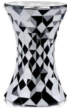
STONE | ストーン