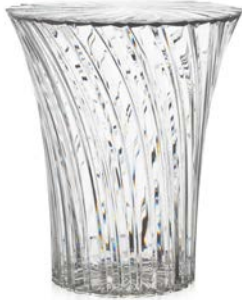
SPARKLE S STOOL | スパークル S スツール